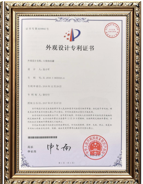
Patente Nº: 201630655323.4