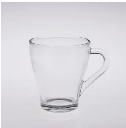
xícara de café de vidro