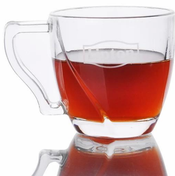
galss xícara de chá