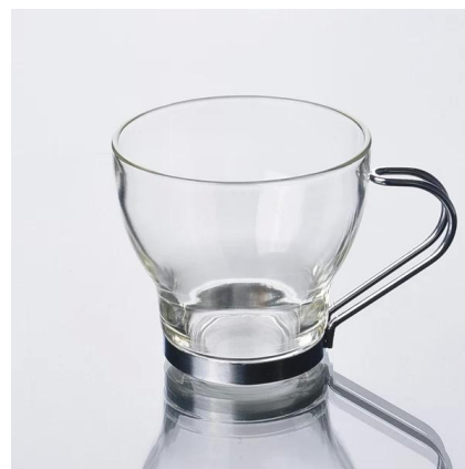
china 190ml xícara de café