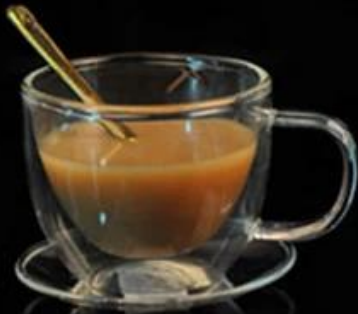
Double Wall Glass