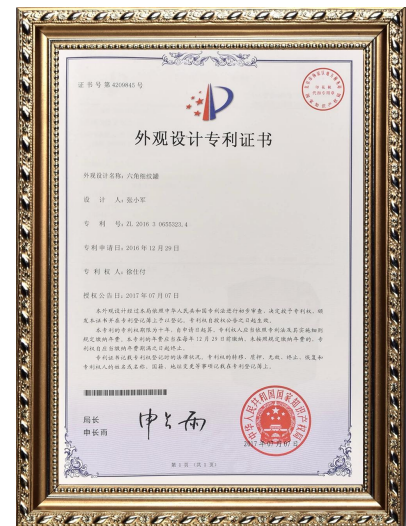
Patente Nº: 201630655323.4