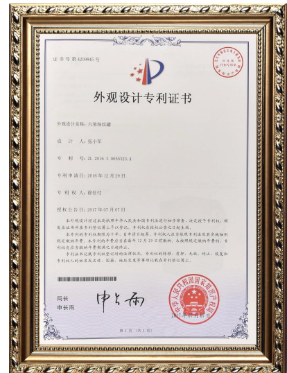
Patente no. : 201630655323.4