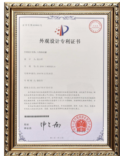
Patente nº: 201630655323.4