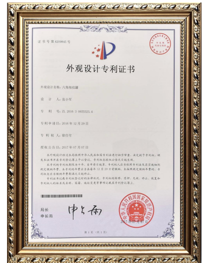
Patente não.: 201630655323.4