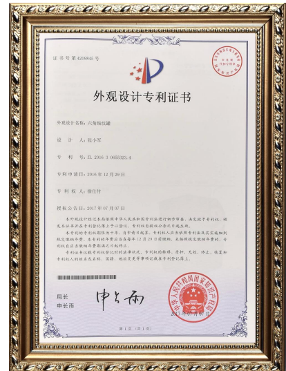
Patente no. : 201630655323.4