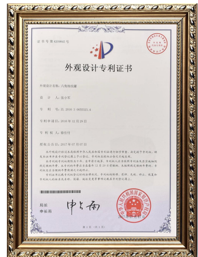
Patente não.: 201630655323.4