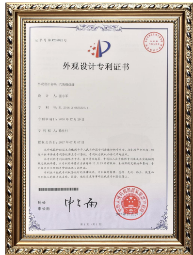
Numer patentowy: 201630655323.4