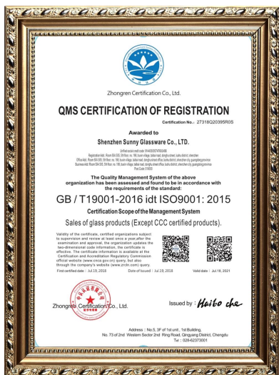
ISO 9001: 2015