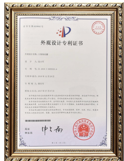
Nr patentowy: 201630655323.4