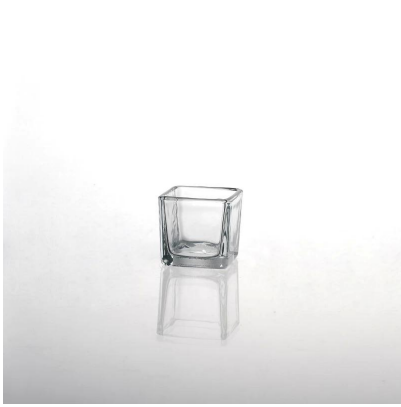
kwadratowe jasne Świece szklane