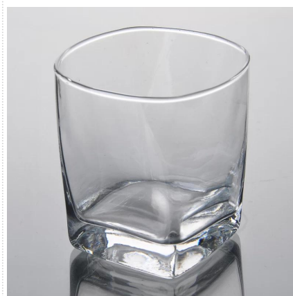
Płac dno szklanki