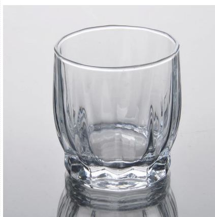
Nowa specjalna konstrukcja grawerowanie wody