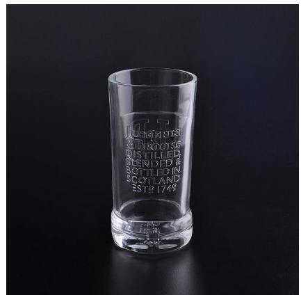
drukowania kalka kieliszki