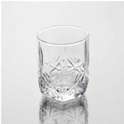
czysty strzał szkło