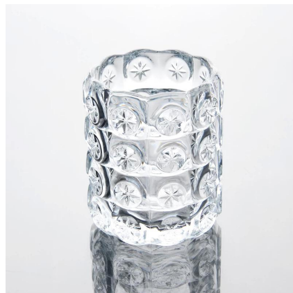
Nowy design kieliszków