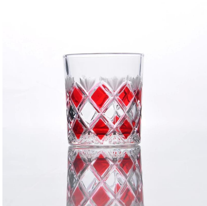
Strzał w kolorze szkła