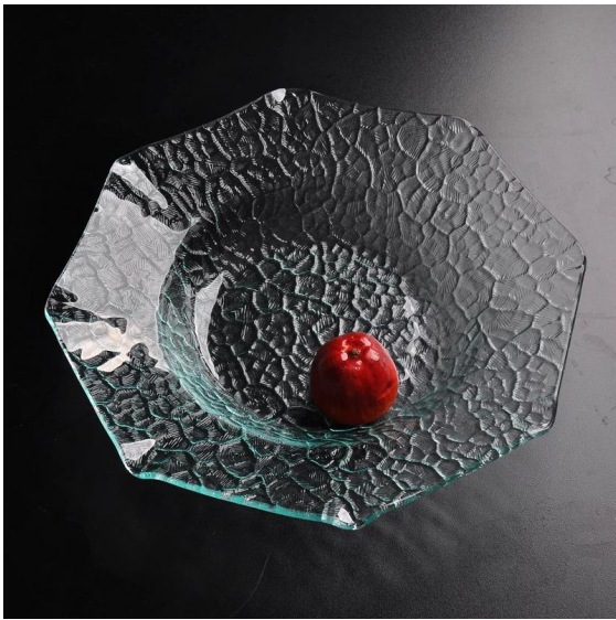
Płyta ze szkła przezroczystego wielokąta