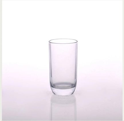
sok woda herbaty mleka spożywczego szkła tumbler