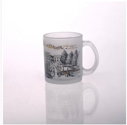
szkło szklanki mleka z obrazka