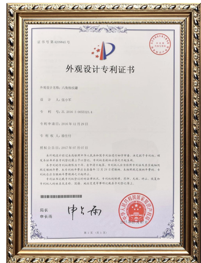
Patent n. 2.201630655323.4