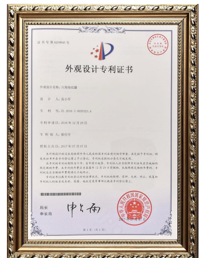
Numer patentu: +201630655323,4