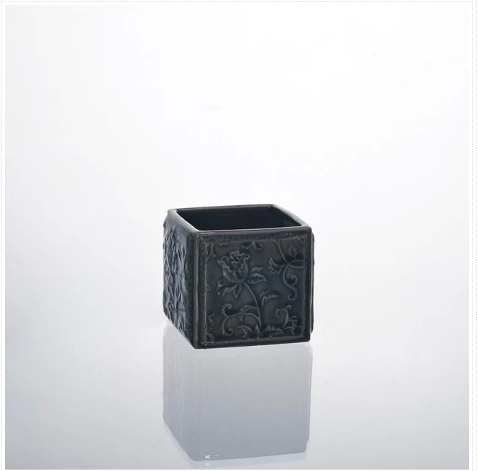
Cylinder ceramiczny świecznik kwadratowy