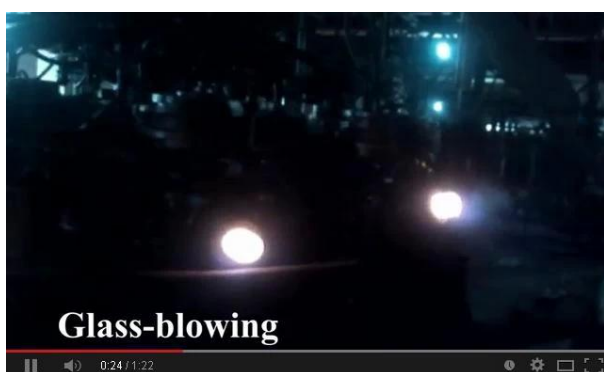
Technologia rozdmuchu maszynowego

Niniejszym obejrzyj wideo naszej linii produkcyjnej online, zapraszamy do odwiedzenia nas na miejscu.