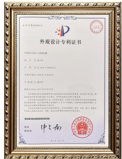
Patent nr: 201630655323.4