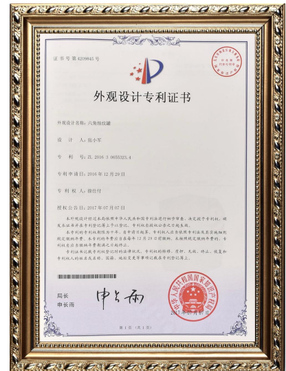
Patent nr: 201630655323.4