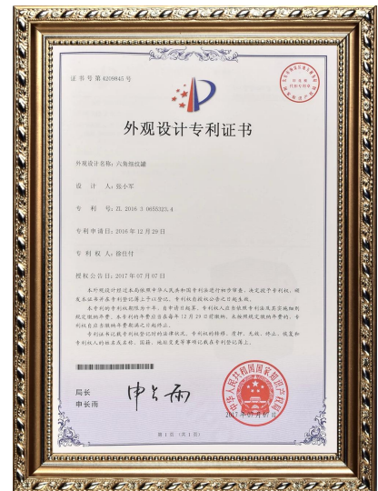
Patent nr: 201630655323.4