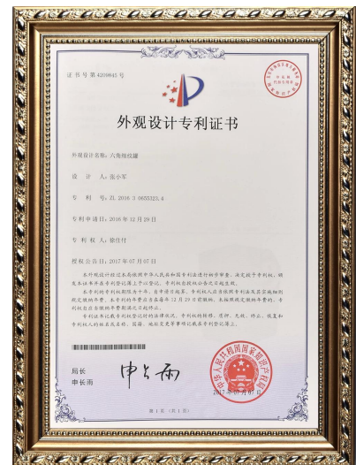
Patent nr: 201630655323.4