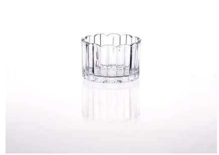
jasne świecznik szkło