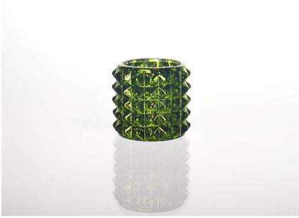
Świeca szkło kolorowe filizanki