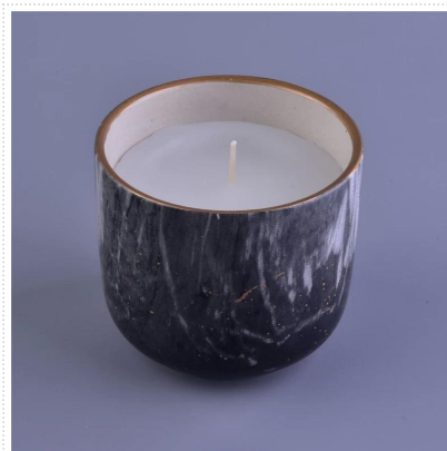
Marmur świece zapachowe w ceramiczna świeca słoik z marmuru naklejki druk