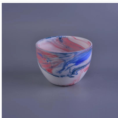
Ozdobne ręcznie robione soy wosku ceramiczna świeca zapachowa jar