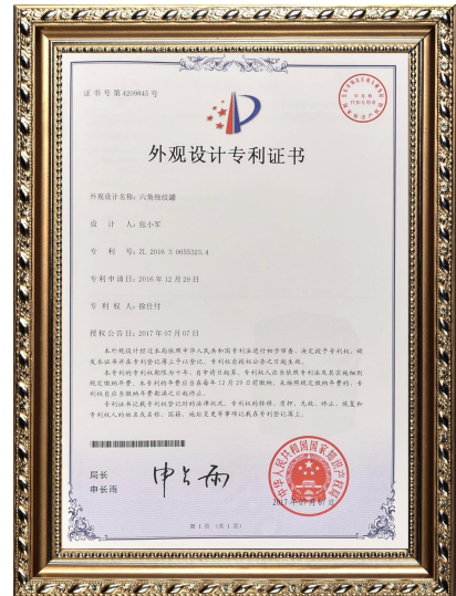
Patent nr: 201630655323.4