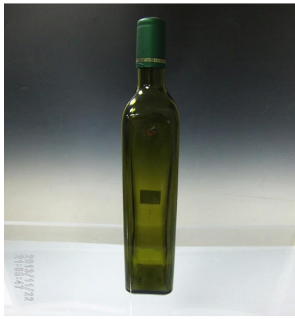
750 ml szampana zielone butelki wina