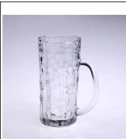
500ml szklanę piwa