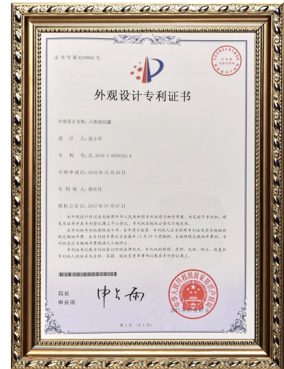
Patent nr: 201630655323.4