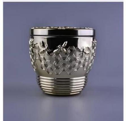
Sunny Brand Story