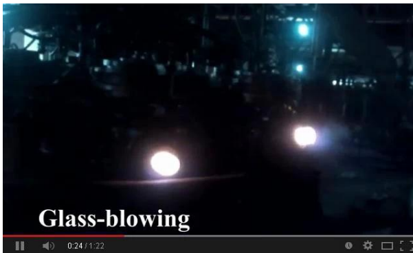
Technologia rozdmuchiwania maszyn