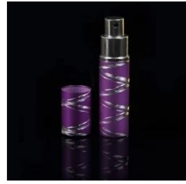
fioletowy kolorowe perfumy szklana butelka