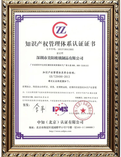
Własność intelektualna przedsiębiorstwa