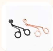
Wick Trimmer Cutter