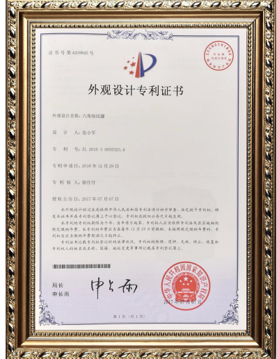
Numer patentowy: 201630655323.4