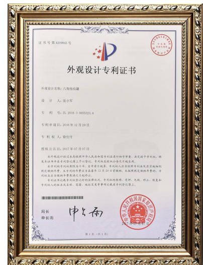
Patent nr: 201630655323.4