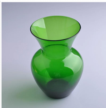
Wazon usta dmuchane