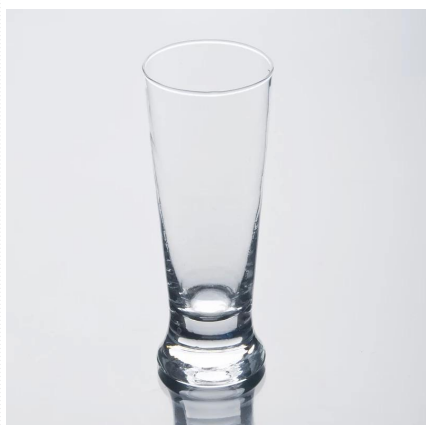
spożywczej szklanki tumbler