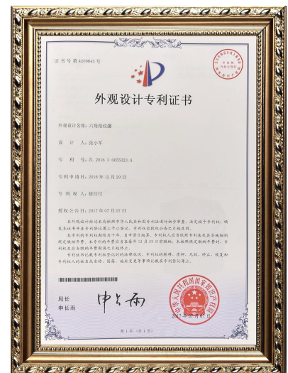
n patentowe .: 201.630.655.323.4