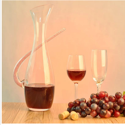
Producenta dostarczonych karafki szkła Whisky