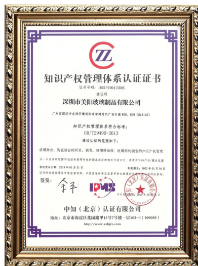
Własność intelektualna przedsiębiorstw