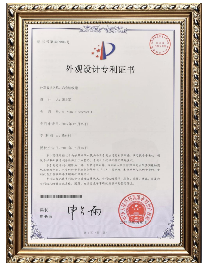
Patent n. 2.201630655323.4