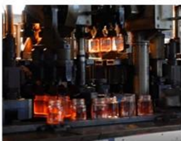
The ranks of machine