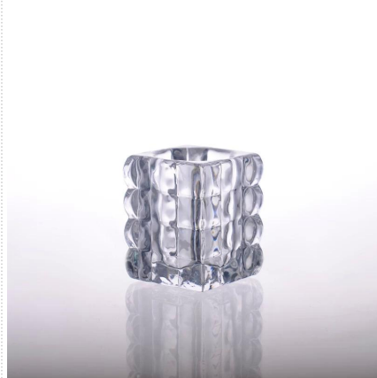
Świecznik szklany kwadrat