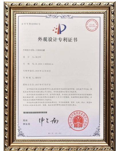
No .: +201630655323,4 patentowy