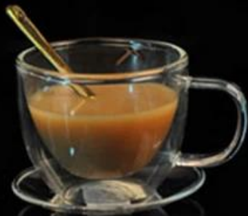
Double Wall Glass