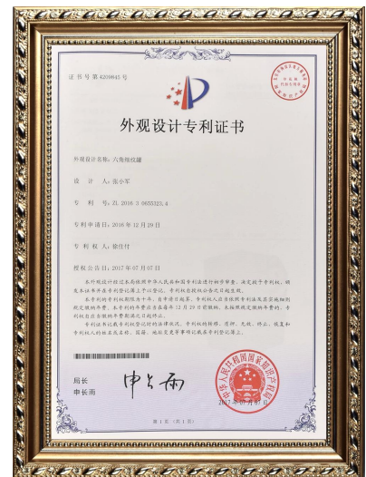
Numer patentu: 201630655323.4