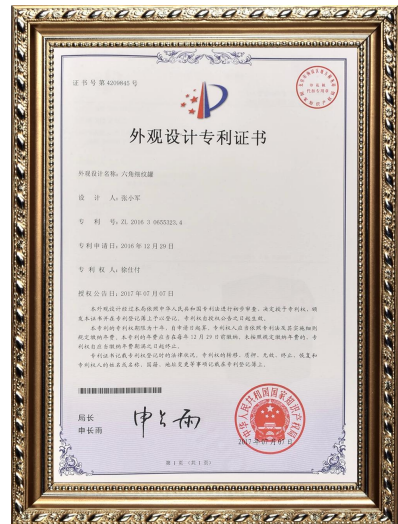
Numer patentowy: 201630655323.4