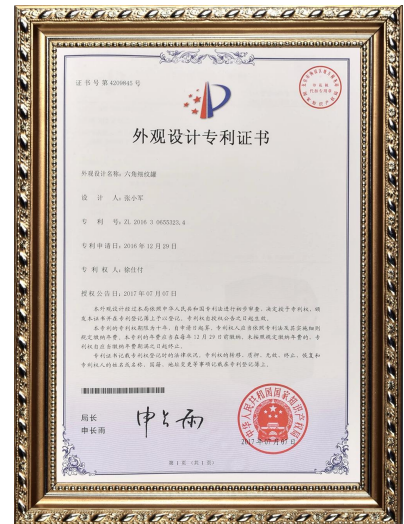
Numer patentowy: 20163065532.4