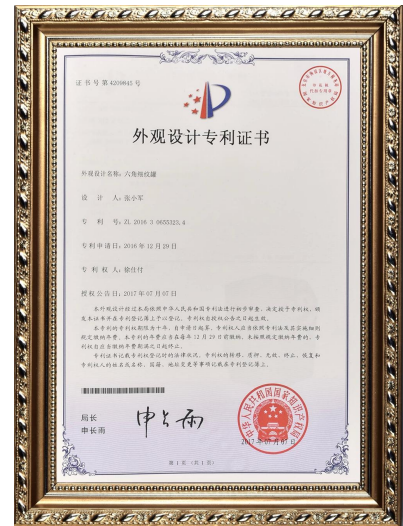
Patent nr: 201630655323.4