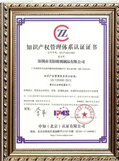
Korporacyjna własność intelektualna Nr patentowy: 201630655323.4